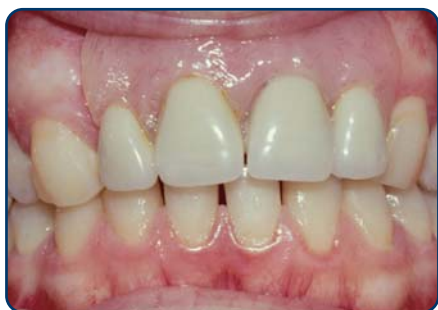
Plaatprothese van voren

De plaatprothese is gemaakt van een roze, tandvleeskleurige kunsthars. Daarin zijn de kunsttanden en -kiezen verankerd. De gehele plaatprothese rust op het slijmvlies van de mond. Deze zit eventueel met ankertjes vast aan overgebleven tanden of kiezen.