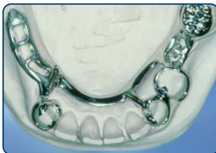
Frameprothese in wording op een gipsmodel, zonder kunsttanden en -kiezen

soort slotje. Bij een slotje wordt de ene kant vastgemaakt aan een kroon, tand of kies en de andere kant zit vast aan de frameprothese. De frameprothese kunt u op die manier in het slotje schuiven. Het slotje zit doorgaans aan de binnenkant van de tanden en kiezen en is dus niet vanaf de buitenkant zichtbaar. Ankertjes zijn vaak wel enigszins zichtbaar.