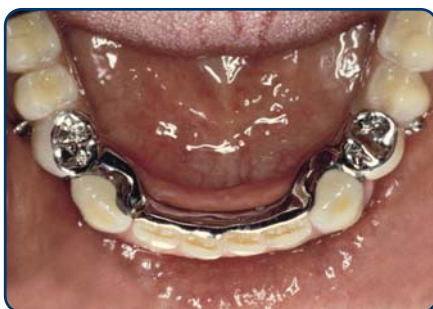
Frameprothese met verankering op kronen