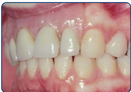
Plaatprothese van opzij